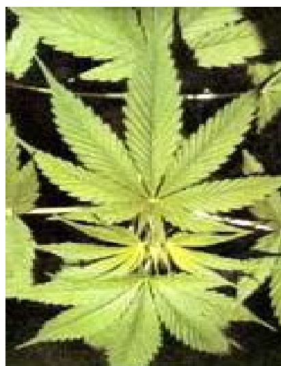
Cannabisväxt. Ser ut som en vanlig grön blomma men har ngt taggigare blad. På latin: cannabis sativa