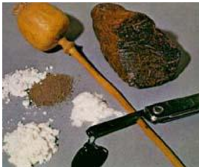
Olika former av opium

En annan skadereduceringsmetod är ersättningsdrogerna Metadon och Subutex, som nu skrivs ut i stor skala även i Sverige. Den teori som ligger bakom är att "craving" dvs suget minskar.