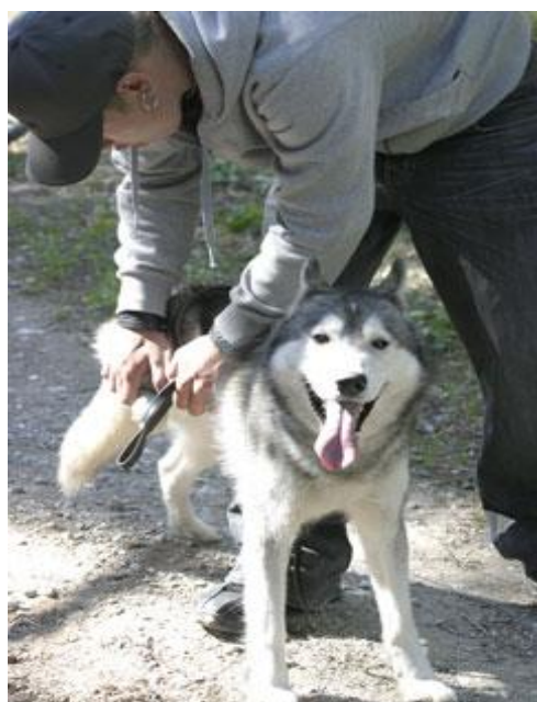
Arbetssele sätts på