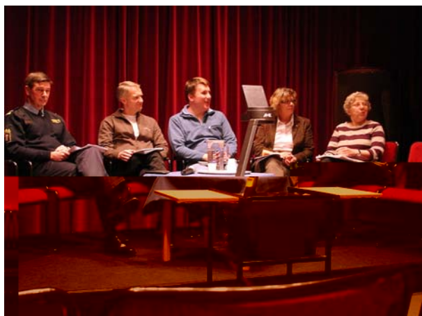
Seminariets panel i väntan på publikens frågor

Panelen gav inga direkta löften om ställa upp med pengar, men den hade förmodligen fått en ökad insikt om att DUNK har en viktig funktion att fylla. Ett visst hopp tändes om att fortsatta förhandlingar skulle kunna ge positivt resultat.