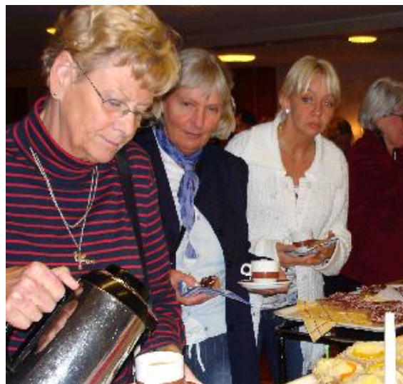
Deltagarna tar paus och låter sig väl smaka av det dignande fikabordet