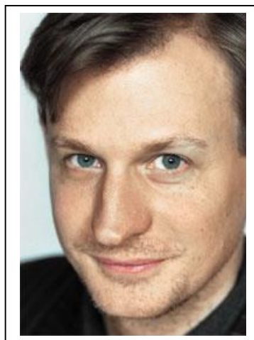
Carl Schlyter, EU-parlamentariker(mp)

Kanske det drar ihop sig till en ny strid om drogpolitiken, men i denna fråga har jag i alla fall stöd från alla svenskar att EU ska hålla sina fingrar borta från detta, åtminstone om det gäller legalisering. Jag undrar hur många av fröna som skickats till EP idag som kommer att odlas?