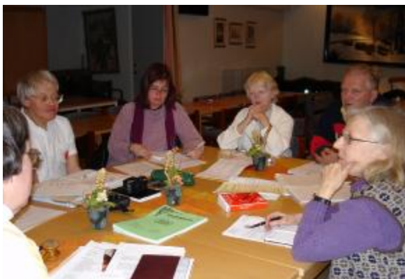
Här redovisas och planeras för Vileda

Vad har hänt senaste året, hur är läget i nätverket just nu och hur ser framtidsplanerna ut? Det var de frågor som skulle besvaras vid kvällens möte som höll till på Allégården.